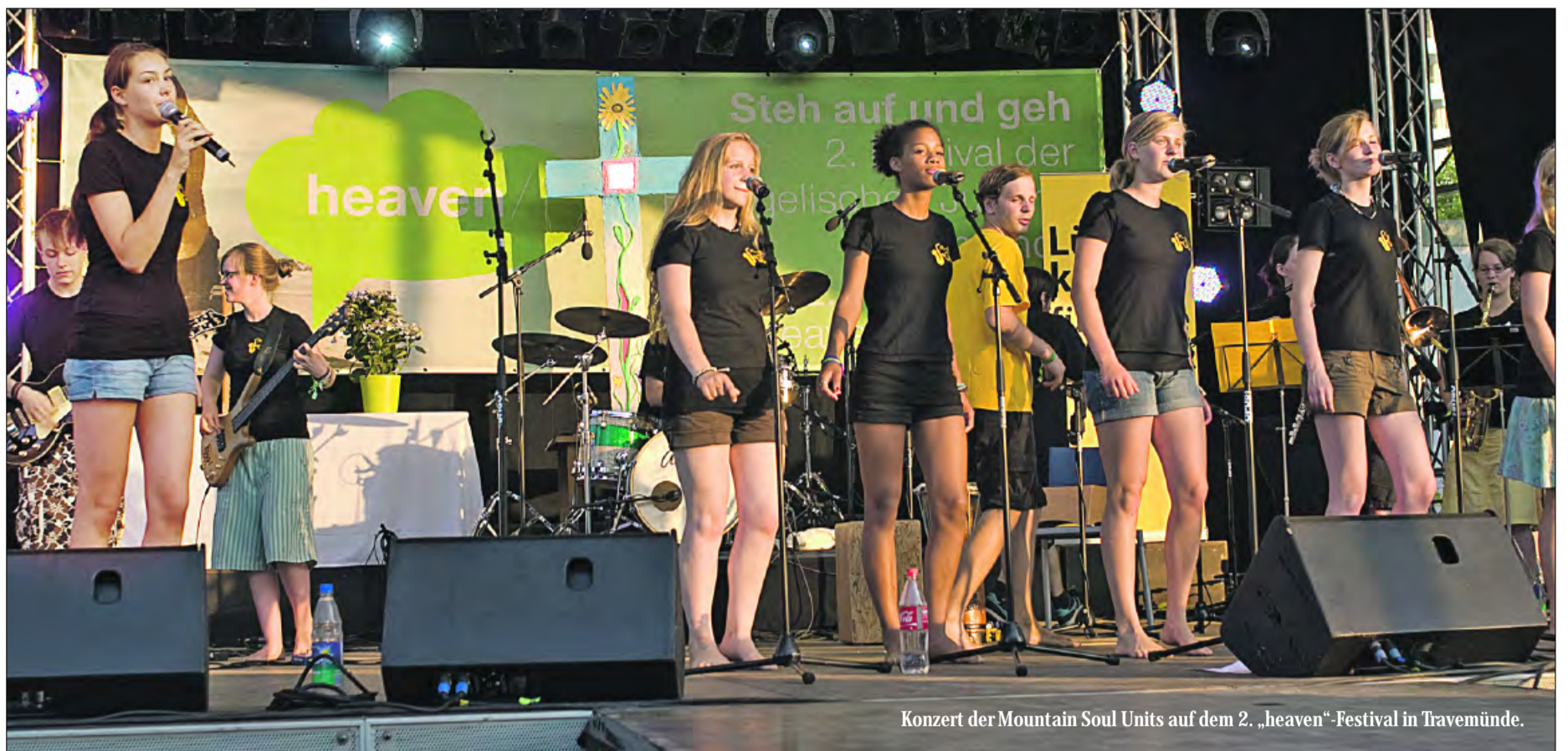
Konzert der Mountain Soul Units auf dem 2. „heaven“-Festival in Travemünde.