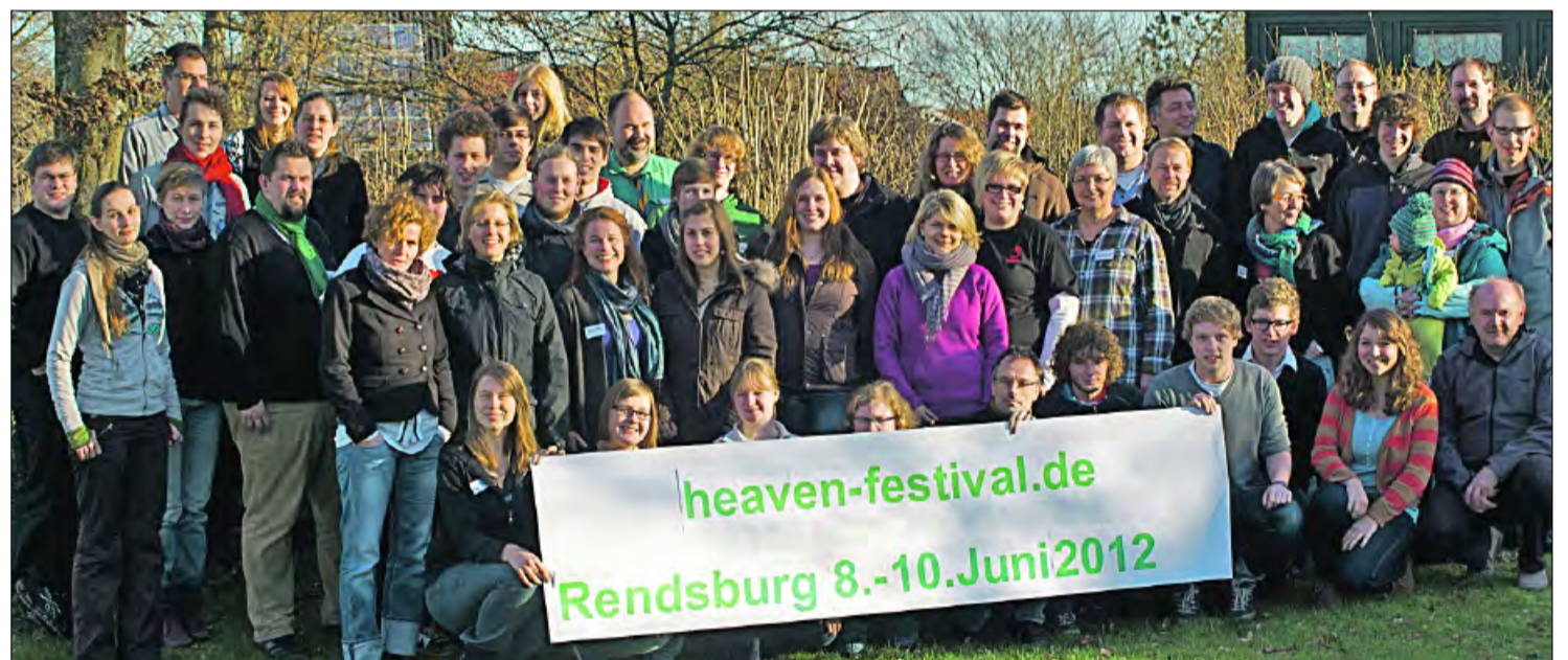
„heaven“-Team 50 Ehren- und Hauptamtliche aus Kirchenkreisen und Verbänden organisieren das Festival. Beim großen Vorbereitungswochenende in Bünsdorf wurde intensiv am Festivalprogramm gestrickt. Besonders freuen sich die Festival-Teamer auf den Besuch aus Indien. Über Videokonferenz waren die indischen Partner beim Vorbereitungstreffen dabei und konnten bereits erste Absprachen und Vorbereitungen via Internet treffen.

RENSBURG – „Fair-eint“ in einer globalen Welt leben, wie soll das gehen? Auf dem „heaven“-Festival wollen wir das ausprobieren und lassen auf dem Schiffbrückenplatz in der Rendsburger Altstadt ein Klimadorf entstehen. Hier können die Festival Teilnehmer Klimagerechtigkeit nachspüren und erleben. Die Ressourcen unserer Erde, wie Wasser, Energie, Nahrung sind begrenzt. Die Werbung und die Interessen der Nahrungs-, Unterhaltungs- und Konsumindustrie sollen uns glauben lassen, es gibt alles im Überfluss, wir brauchen nur zugreifen. Das Klimadorf zeigt die andere Realität. Viele Angebote der Jugendlichen aus den Kirchenkreisen Plön-Segeberg, Rendsburg-Eckernförde und Ahrensburg sowie der Informationsstelle für Klimagerechtigkeit IKG, dem Verband christlicher Pfadfinder SH und Brot für die Welt laden dazu ein, sich für Klimagerechtigkeit zu engagieren. Mitmachen lohnt sich. Das Wasserwerk H2O Global informiert mit einer Ausstellung über den globalen