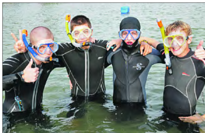
Beim Schnorchel-Transect erforschen die KlimaSegler aus Nordelbien, Finnland und Lettland den Bewuchs des Meeresgrundes.