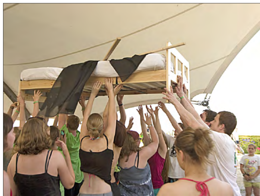
Anspiel zur Predigt „heaven2010“: Steh auf und geh!

Als evangelische Jugendarbeit stellen wir uns der Herausforderung, das „heaven“-Festival inklusiv zu gestalten (siehe Kasten). Gemeinsam bereiten Jugendliche mit und ohne Behinderung drei aufregende Tage in Rendsburg vor. Wir wollen barrierefrei und gemeinsam Spaß haben, spielen, Musik machen, Gottesdienste feiern und vielseitige Workshops für alle anbieten. In der Disco, im Mitternachtskino und in den Cafés lernen wir uns kennen, auf dem Segelschiff „Zuversicht“ laden junge Menschen mit Behinderungen zu Getränken und Gitarrenmusik ein. Alle Schulen und Werkstätten, die mit Jugendlichen und jungen Erwachsenen mit unterschiedlichsten Behinderungen arbeiten, sind ganz herzlich zu unserem Jugendfestival „heaven“ in Rendsburg eingeladen, dabei zu sein und mitzuwirken. Je mehr Gäste wir begrüßen können, desto schöner wird unser Festival. Beim letzten Festival in Travemünde haben wir das schon ausprobiert und festgestellt, die größten Barrieren sind in unseren Köpfen – wenn wir diese abbauen, klappt vieles, was wir nicht gedacht haben.