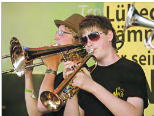
Die Mountain Soul Units sind wieder dabei.

RENSBURG – Vom 8. bis 10. Juni 2012 wird die Rendsburger Altstadt zum Gastgeber des 3. „heaven“-Festivals der Evangelischen Jugend. Eingeladen sind Jugendliche und Jugendgruppen aus Kirchengemeinden und Kirchenkreisen sowie Jugendverbänden und Schulen. Das Motto des Festivals ist „... fair-eint“, ein fairer Lebensstil bei uns zuhause aber auch als globale Herausforderung steht im Mittelpunkt. Zusammenleben geht nur gemeinsam und fair, ob in der Jugendgruppe oder bei weltweiten Klimafragen. So freuen wir uns besonders auf unsere jungen ökumenischen Gäste unserer Partnerkirche aus Indien, die das Festival mitgestalten werden. Erste Eckpfeiler stehen für das kommende „heaven“-Festival. So wird der Schiffbrückenplatz in der historischen Altstadt von Rendsburg zum Wohnzimmer der evangelischen Jugend. Auf der „heaven“-Bühne treten Bands, Chöre und Theaterprojekte auf. Spiele, Aktionen und Orte zum Chillen lassen den Platz zum bunten Markt der Jugendarbeit werden. Im Klimadorf könnt ihr Jugendliche aus ökumenischen Partnerländern treffen, die Aus-